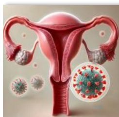
HPV nouveautés, vaccin et frottis