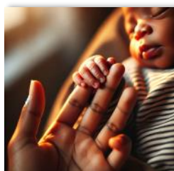
Le lien parents enfants