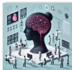
Hypnose en salle d'accouchement

Nos experts conçoivent des parcours sur mesure pour répondre aux spécificités de votre établissement et garantir une formation de qualité optimale.