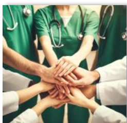
Résolutions de conflits

Nous proposons également des formations conçues exclusivement pour vous .